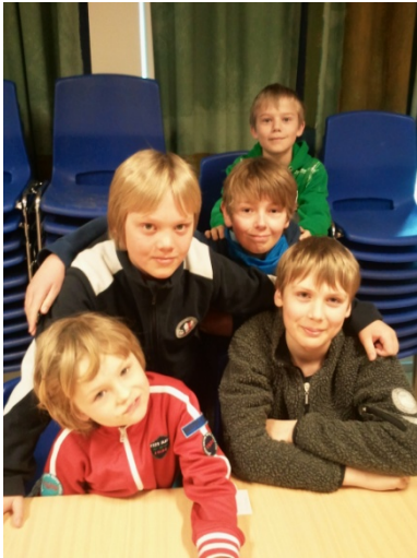
Laget er klar til innsats.