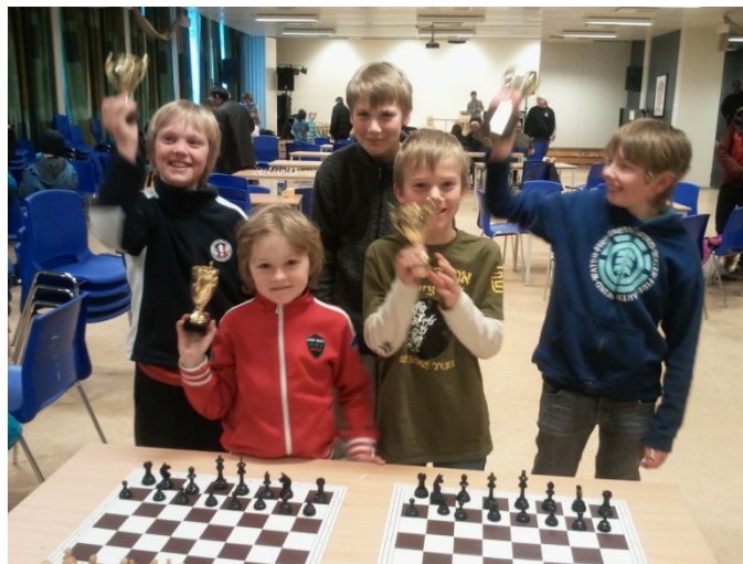
Fem glade pokalgutar etter endt turnering.

Alle på laget gjorde ein super innsats, med gode resultat langt over forventning. To runder på rad scora vi som lag fire av fem moglege poeng!